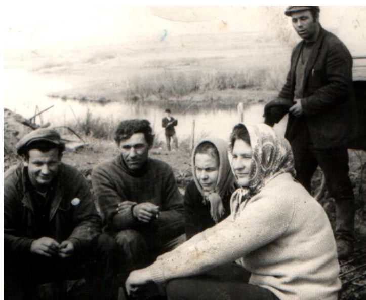
Рабочие совхоза на разбивке и посадке сада.