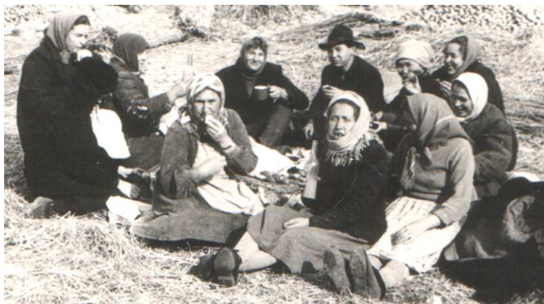
4 отделение совхоза "Есенгельда" на картошке.