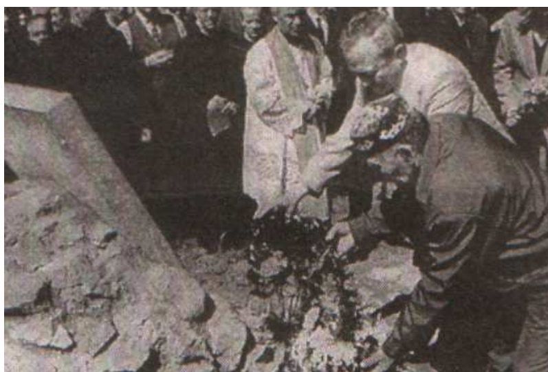
Село Жартас. Мамочкино кладбище. 31 мая 2003 г.

На "Мамочкином кладбище" есть общая могила, на котором лежит безымянный камень. В ней похоронены сразу 32 ребенка, которые умерли в течение 3-х дней. Причина смерти не была выяснена.